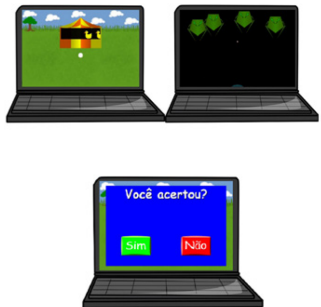
Figura 1. Exemplos das telas dos jogos na parte superior (Tiro ao pato, à esquerda e Invasores do Espaço, à direita) e da tela de relato (porção inferior).

O software , desenvolvido por Cortez et al. (2014), permite o registro automático das respostas dos participantes tanto com relação ao desempenho na tarefa de tiro ao alvo (acertos ou erros) quanto às respostas de relato (escolha do quadrado verde ou vermelho). Além disso, o software possibilita a manipulação, pelo experimentador, da dificuldade da tarefa a cada tentativa, por meio do ajuste de parâmetros como a distância do alvo, o número de obstáculos dispostos à frente do alvo, a quantidade de alvos, dentre outros.